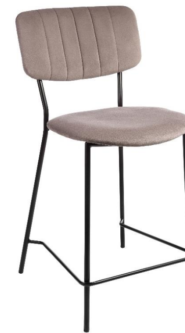
AV 454 Bar